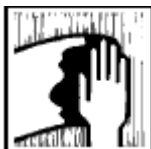
Использовать тканевую или бумажную салфетку